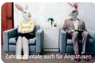
Zahnimplantate auch für Angsthasen

Implantate geben verloren gegangene Lebensqualität zurück. Bereits mit 6 Implantaten lassen sich festsitzende Keramikbrücken in einem zahnlosen Kiefer sicher und dauerhaft auf Implantaten befestigen.